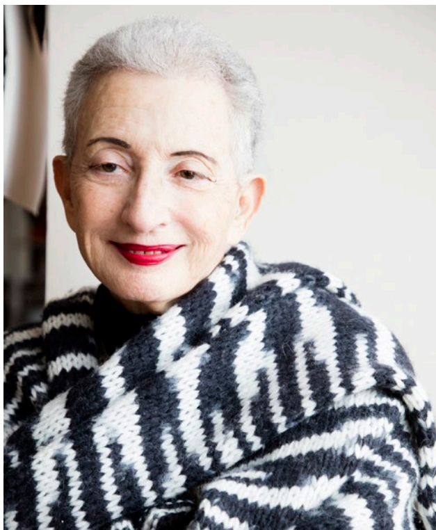
Francesca Mantovani/Gallimard (2018)

Présidente d'honneur du 38 e bis Marché de la Poésie