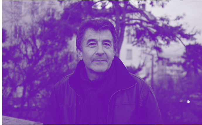
▲ © PATRICIA CARROT ▲

Gratuit, réservation conseillée. Infos : 04 78 62 18 00