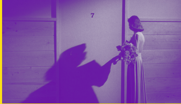
▲ © DR ▲

Infos : https://billetterie.periscope-lyon.com/