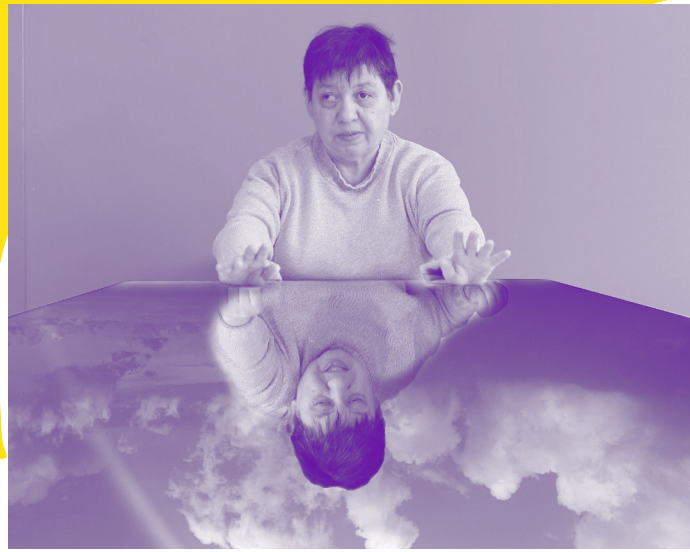
▲ © LAURENCE LOUTRE-BARBIER ▲