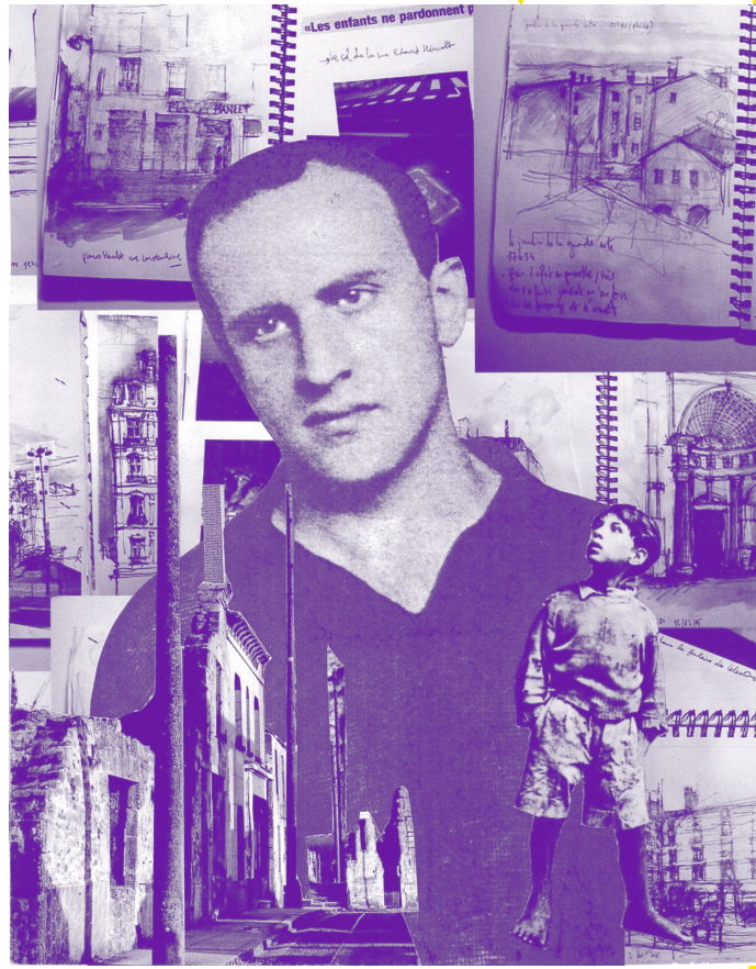
▲ © COLLAGE – SONIA VIEL ▲

Infos : 04 78 78 33 30 / contact@nth8.com